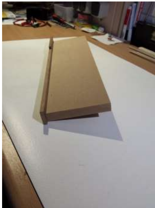
Hobellade 13° für den Balgblock