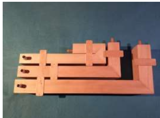
Für die Befestigung auf der Bodenplatte sind rückseitig je 2 Montage- laschen verleimt.