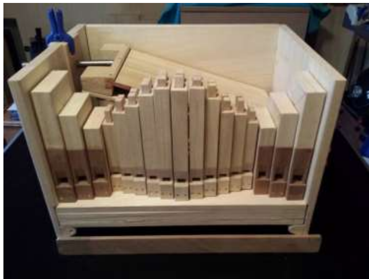
Einbau der überlangen Pfeifen in das Gehäuse.

Die Pfeifen haben hier noch eine Überlänge von ca. 40-50mm. Die Einkürzung folgt später bei der Stimmung der Pfeifen.